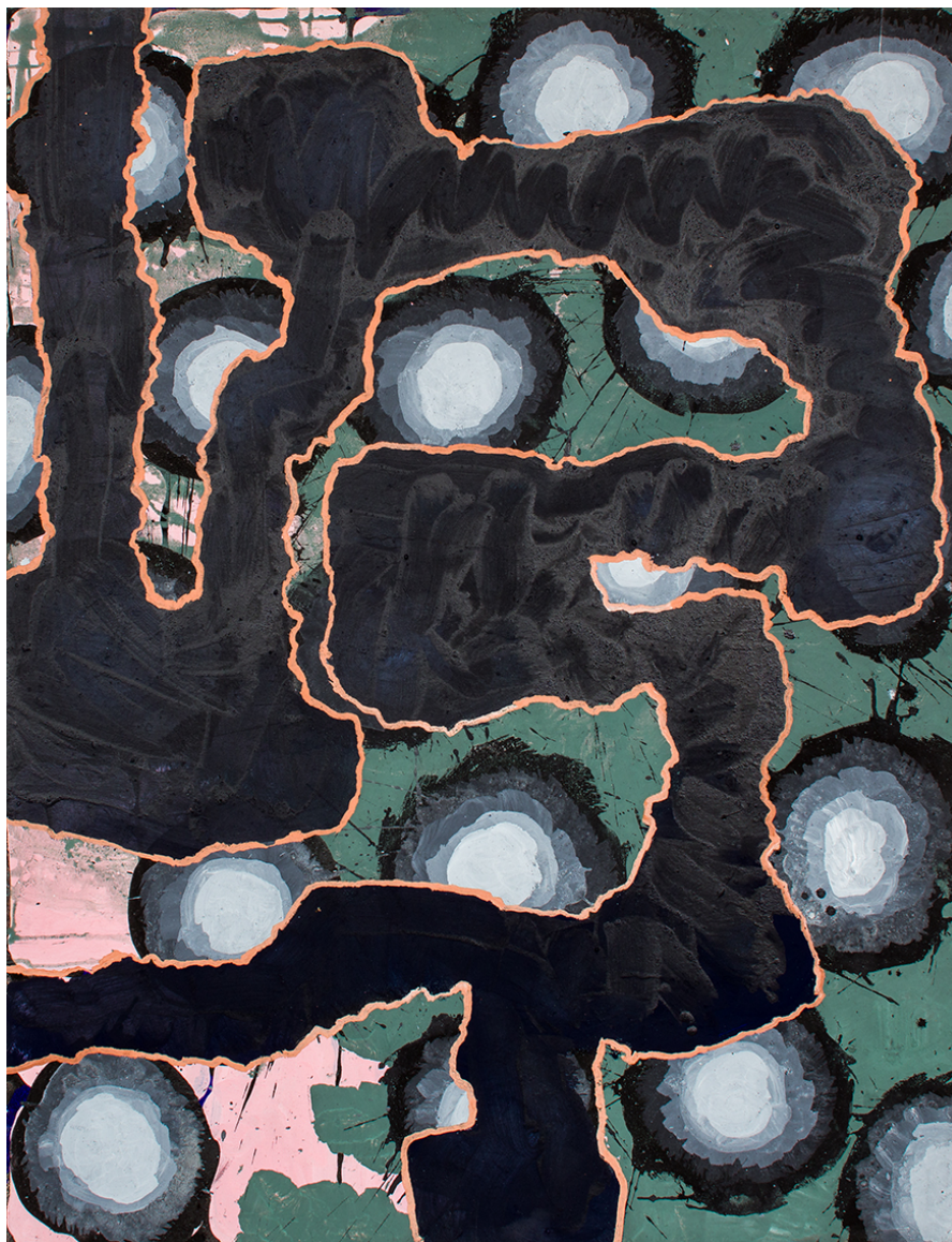
Sans titre, 2020, acrylique sur toile, 127 x 97cm

Extraits du texte de Diana Quinby « Les Nouveaux rebondissements de Philippe richard »