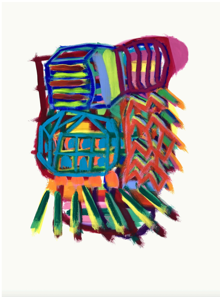
Sans titre, 2022, pastel sur papier, 76 x 56cm