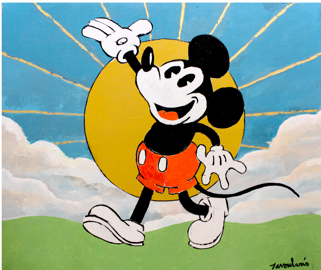
Mickey Mouse, 2012, acrylique sur toile, 46 x 55 cm

Exposition réalisée grâce à l'aide précieuse de l'actrice Aurore Clément.