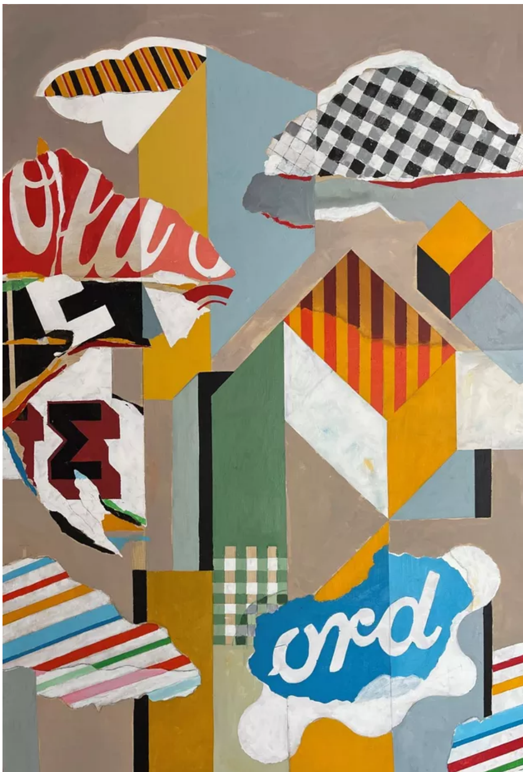
Sans titre, 2020, acrylique sur toile, 130 x 89 cm

7, rue Charles Fournier - 63400 Chamalières contact@galerielouisgendre.com - www.galerielouisgendre.com