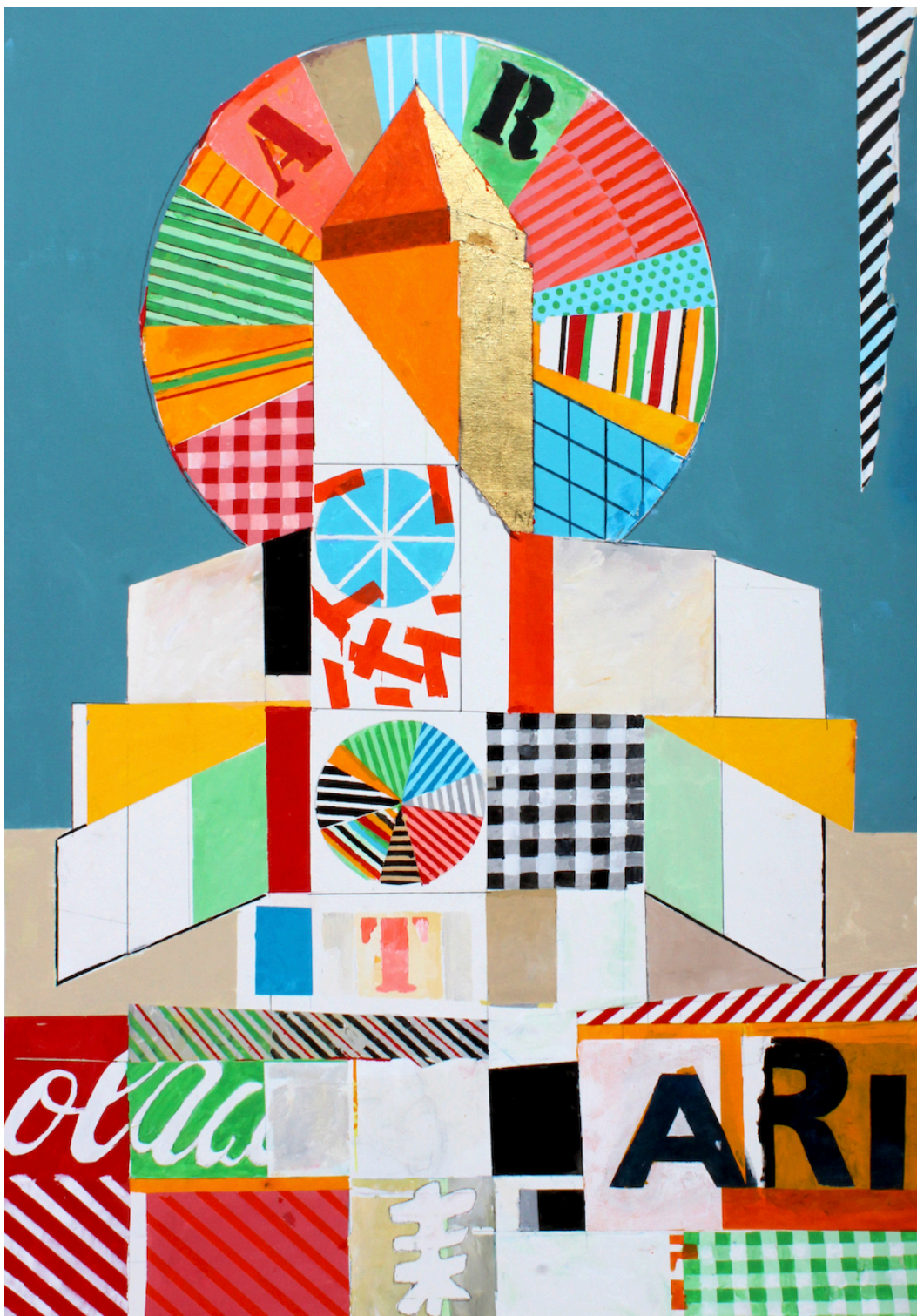
South American Building, 2022, mixte sur toile, 130 x 89 cm

7, rue Charles Fournier - 63400 Chamalières contact@galerielouisgendre.com - www.galerielouisgendre.com