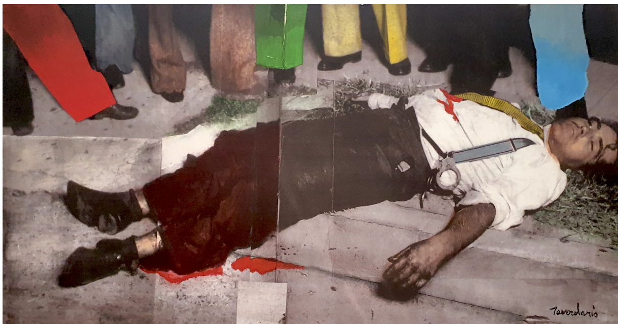
Dead man in the street, 2007, acrylique et photographie sur toile sensibilisée, 109 x 55,5 cm

Né en 1932 aux Etats-Unis, Dean Tavoularis entreprend des études d'architecture et d'art. C'était l'éducation parfaite pour un directeur artistique au cinéma puis il a tenté la « Cathédrale de l'Art », les studios Walt Disney et, à sa grande surprise, il a été engagé. C'étaient les années 50. Au bout d'un an Walt Disney lui a judicieusement offert de le transférer au département artistique des films et acteurs. Pendant les 7 années où « il a travaillé, il était libre de peindre ». Plus tard quand Dean Tavoularis a quitté Disney pour être décorateur il était devenu impossible de peindre. « J'ai travaillé pour différents Studios, j'ai voyagé pendant des années, toujours tiraillé entre deux désirs conflictuels : ma peinture et mon nouveau travail si excitant dans le cinéma. »