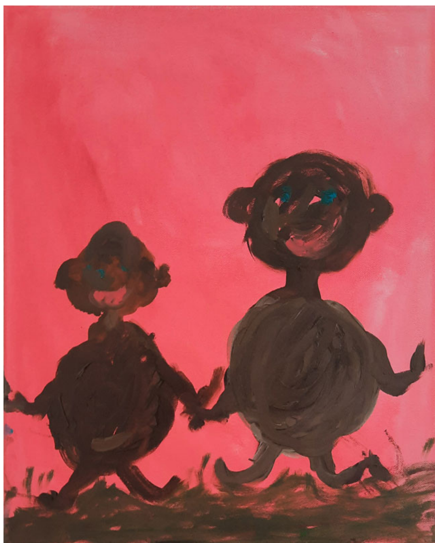
June Treister, Two Bears , 2024, huile sur toile, 41 x 33 cm

7, rue Charles Fournier - 63400 Chamalières contact@galerielouisgendre.com - www.galerielouisgendre.com