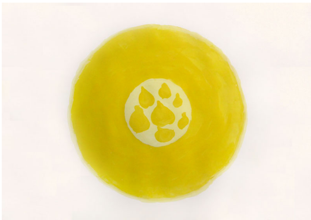
June Treister, Fig Plate Yellow , 2017, aquarelle sur papier, 21 x 29,7 cm

Mercredi 26 mars 16h - 19h et dimanche 30 mars 10h - 12h30